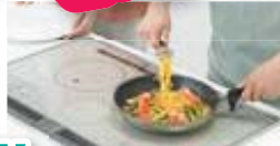
写真は、イメージです。

オール電化システム 安心・安全・火のない生活 IHクッキングヒーターお料理実演会 開催!!